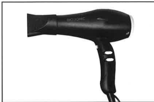
MODEL GoldPro™ 1875W SPEED DRYER – 220V

Děkujeme Vám za zakoupení Bio Ionic GoldPro™ 1875W SPEED DRYER.